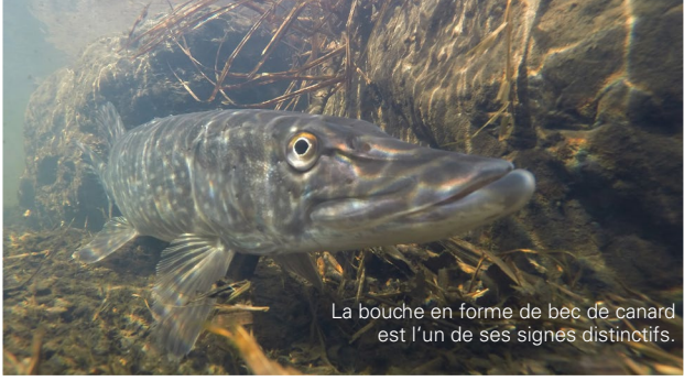
La bouche en forme de bec de canard est l'un de ses signes distinctifs.