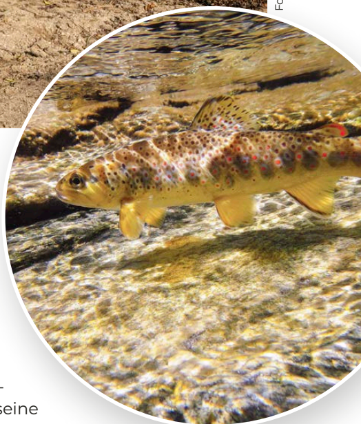
Im Fokus vieler Aufwertungen steht die Forellenregion in tieferen Lagen – hier drohen die grössten Verluste, wenn wir nichts dagegen unternehmen.

Rundum gelungener Workshop am Bruggbach. Im Kanton Bern geniesst «Fischer schaffen Lebensraum» grossen Rückhalt bei Regierung und Verwaltung.