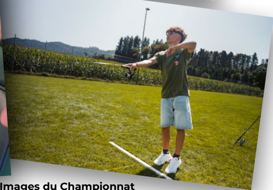
Images du Championnat des jeunes pêcheurs 2024.