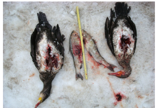
Cormorans voraces : des ombres de plus de 40 cm de long !

La grande surprise en ce qui concernait l'autorisation des mesures a été le moment. Roland Seiler : « Les cantons ont déposé leur demande de mesures de régulation le 15 mars 2010, l'OFEV a tranché le 25 mars 2010. » Pour lui, il s'agit là de la récompense du travail obstiné réalisé par la FSP à l'encontre des oiseaux piscivores. La FSP a ainsi par