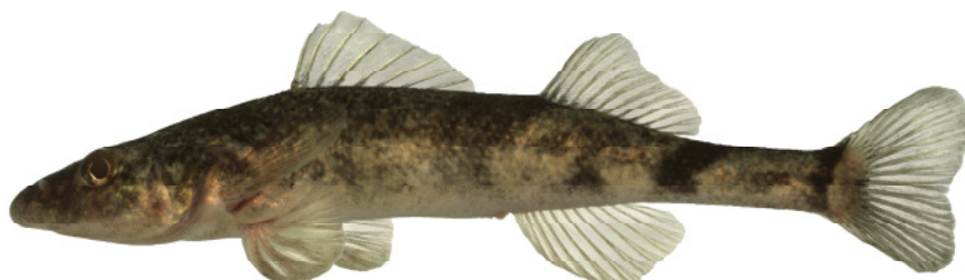
La Fédération Suisse de Pêche a élu "Poisson de l'année 2013" le Roi du Doubs - une espèce très proche de l'extinction.

Pour eux, l'objectif à long terme est l'instauration d'un statut juridique détaillé, spécifique à la rivière frontalière franco-suisse, qui compte parmi les tronçons de cours d'eau les plus précieux de Suisse. C'est le seul moyen de préserver le « roi du Doubs », menacé