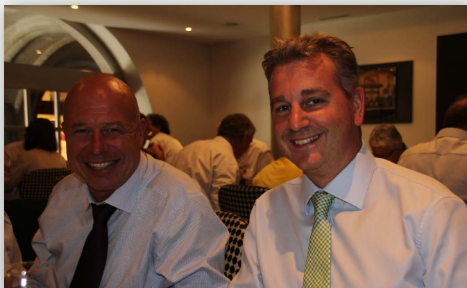
Les Conseillers nationaux Fabio Regazzi (PDC, TI) et Marco Chiesa (UDC, TI).