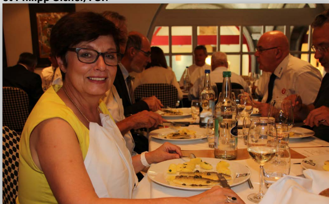
La Conseillère aux Etats Anita Fetz (PS, BS) apprécie le poisson frais du lac des Quatre-Cantons.