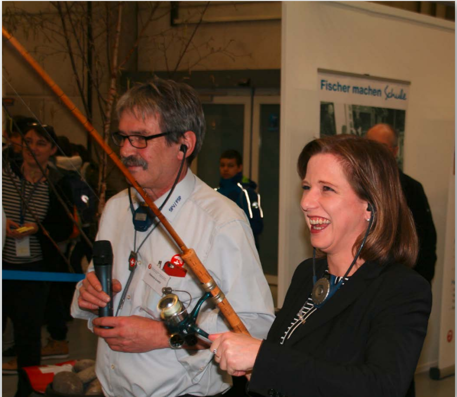
La présidente du Conseil national, Christa Markwalder, pêche le premier exemplaire du manuel «Les pêcheurs aménagent l'habitat», sous le regard des nombreux invités au vernissage