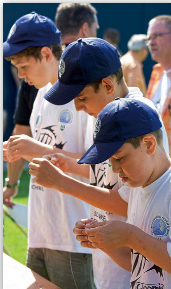
Un travail d'équipe concentré et beaucoup d'expertise seront nécessaires pour monter sur le podium.

Le Championnat des jeunes pêcheurs sera agrémenté d'un programme annexe diversifié: une véritable fête de la pêche sera mise sur pied. Et comme