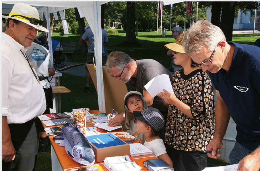
Die Bevölkerung kann sich verstreut über die ganze Schweiz am Schweizerischen Tag der Fischerei an zahlreichen Ständen informieren.

An diesem Tag bietet sich die seltene Gelegenheit, den «Wissensdurst» der interessierten Bevölkerung mit Fachkompetenz zu löschen – aber auch das Erlebnis und der Spass sollen nicht zu kurz kommen; dabei sind der Kreativität keine Grenzen gesetzt. Wie wäre es zum Beispiel mit feinen Fischrezepten zum Abgeben – oder wieso nicht gleich vor Ort ein köstliches Fischmenu zubereiten? Der feine Duft wird sicherlich viele Feinschmecker anlocken. Beim Angelwurf-Zielschiessen können