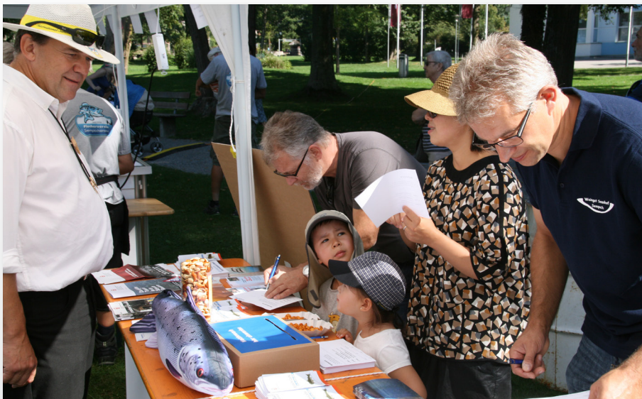
Lors de la Journée Suisse de la Pêche, la population pourra s'informer dans d'innombrables stands à travers toute la Suisse.

Cette journée offre l'occasion unique d'étancher avec professionnalisme la «soif de connaissances» de la population intéressée – mais l'expérience pratique et le plaisir ne seront pas oubliés pour autant car dans ce domaine la créativité n'a pas de frontières. Comme par exemple la transmission de savoureuses recettes de poisson – et pourquoi pas la préparation sur place d'un succulent menu à base de poisson? Le délicieux