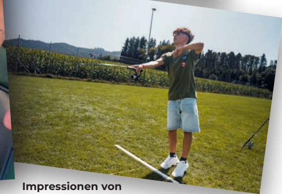
Impressionen von der Jungfischermeisterschaft 2024.