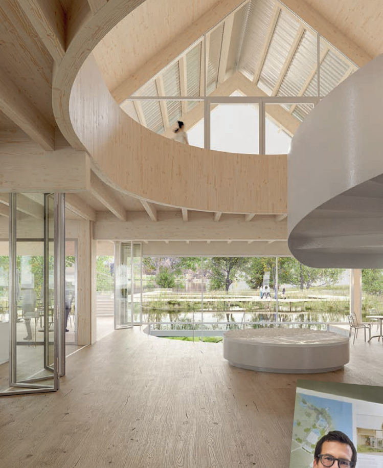
Der geplante Holzbau mit zum See hin ausgerichteten Satteldächern.